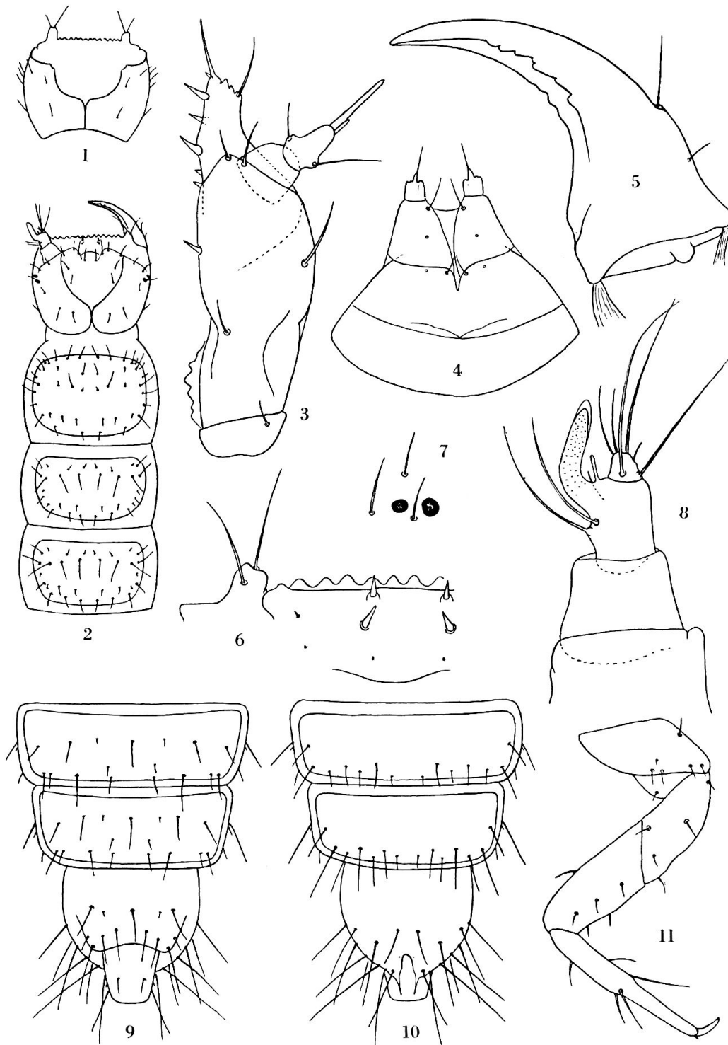
Fig. 1 à 11. — Larve du Plectophloeus Fischeri . — 1. Tête, face ventrale. — 2. Avant-corps, face dorsale. — 3. Maxille gauche, face ventrale. — 4. Labium, face ventrale. — 5. Mandibule droite, face ventrale. — 6. Nasal, face dorsale. — 7. Disposition des stemmates, côté droit. — 8. Antenne gauche, face dorsale. — 9. Arrière-corps, face ventrale. — 10. Id., face dorsale. — 11. Patte antérieure droite.