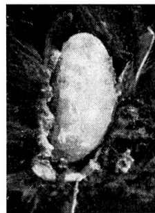
Fig. 3. — Nymphe.

Les dégâts de B. varius OL. sont de même nature que ceux des Apions, c'est-à-dire que les larves se nourrissent des jeunes fruits de Trifolium . Chaque larve en consomme plusieurs jusqu'à son complet développement et l'on trouve généralement plusieurs larves dans chaque capitule. Par exemple, dans un échantillon de 200 capitules récolté en août 1951, nous avons dénombré un total de 440 insectes. On peut en déduire que B. varius OL. est sans doute capable de provoquer des dégâts économiquement significatifs.