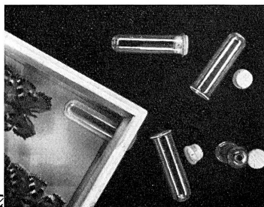
Fig. 2. — Schleusen-Röhrchen mit zugehörigen Pilzkorken vor und nach dem Einbau.