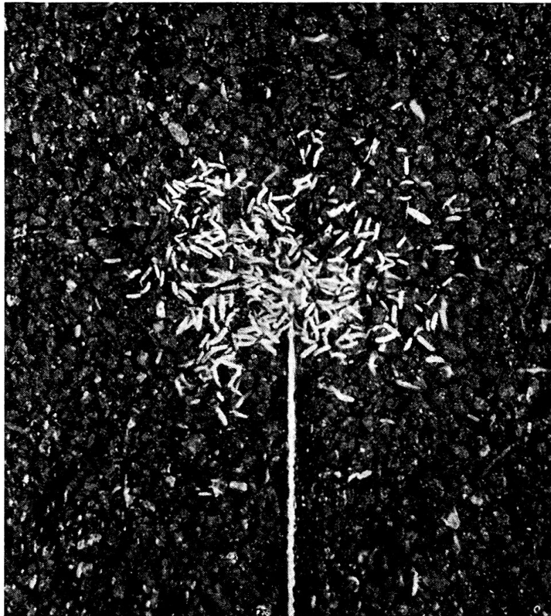
Abb. 2. — Ansammlung von Collembolen um die Mündung einer \text{CO}_2 -führenden Kapillare (ca 3-fache Vergrößerung).

Die Feststellung, dass Collembolen sich ebenfalls nach \text{CO}_2 -Gradienten orientieren, stützt die Vermutung, dass diese Orientierungsart unter den Bodenlebewesen weit verbreitet ist. Dies umso mehr als die hier untersuchte Spezies systematisch mit den früher erwähnten Fällen keineswegs nahe verwandt ist.