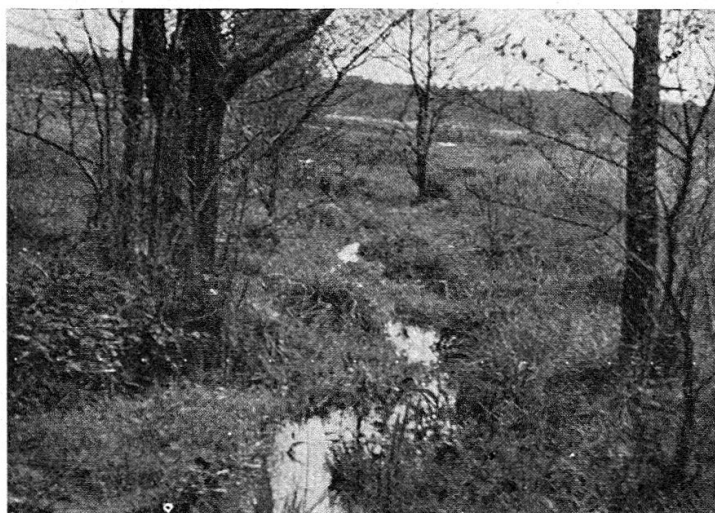
Abb. 1. Abfluss aus dem Hochmoor in Ldzań. Fundort der Larven von Nemoura dubitans MORTON.

Weitere Untersuchungen erlaubten mir, die Larve von N. dubitans zu determinieren und zu beschreiben. Anfangs April 1962 habe ich viele Larven dieser Plecopterenart gesammelt. Eine Anzahl lebender Larven habe ich im Aquarium gezüchtet. Damit erhielt ich 8 männliche und 7 weibliche Imagines samt Exuvien von N. dubitans . Ausserdem