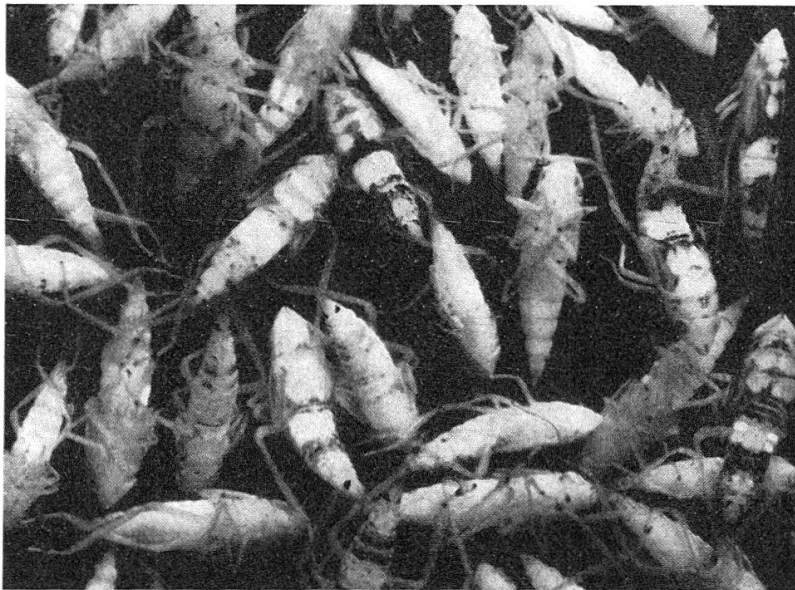
Fig. 3. — Détail d'une capture de larves et de nymphes de Scaphoideus littoralis (dans liquide de conservation).

1,3 mm. D'après les informations données par les auteurs cités et les observations que nous avons faites jusqu'à présent au Tessin, nous pouvons résumer ainsi le cycle biologique de S. littoralis : l'insecte hiverne à l'état d'œuf pondu dans les anfractuosités de l'écorce du bois de deux ans. Les premières éclosions ont lieu vers la fin du mois de mai ; tous les stades larvaires sont cependant visibles, notamment à la fin juin et pendant le mois de juillet. D'après les renseignements fournis par Vidano, la période d'éclosion est très longue, la durée de la vie larvaire varie entre 30 et 50 jours et la vie active des adultes ne dépasse pas la durée d'un mois. Les derniers stades de nymphose se