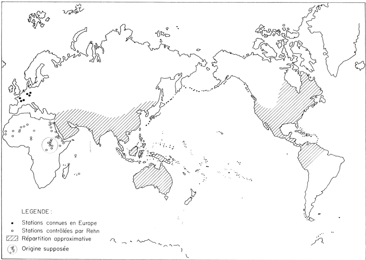
Fig. 3. — Répartition géographique de Supella supellectilium SERV. (Dessin G. Dajoz.)