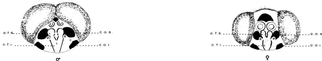
Fig. 2: Chrysops melicharii MIK.