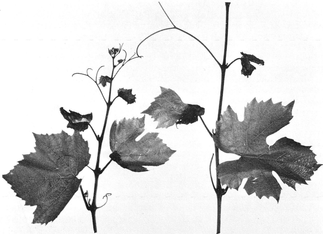
Fig. 3: Phytotoxicité des RCI sur Gamay: faibles brûlures des jeunes feuilles.