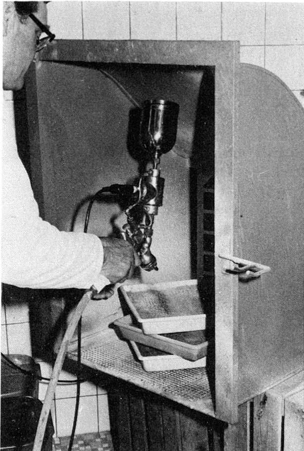
Abb. 2: Paraffinierung des in die Schalen eingefüllten Nährbodens.