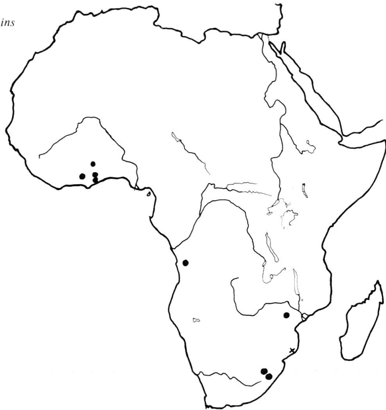
Fig. 11: Répartition de Eucinetus africains (●, Eucinetus elongatus ; x, Eucinetus enavanis ).

les angles postérieurs presque droits. Scutellum triangulaire, aussi long que large.