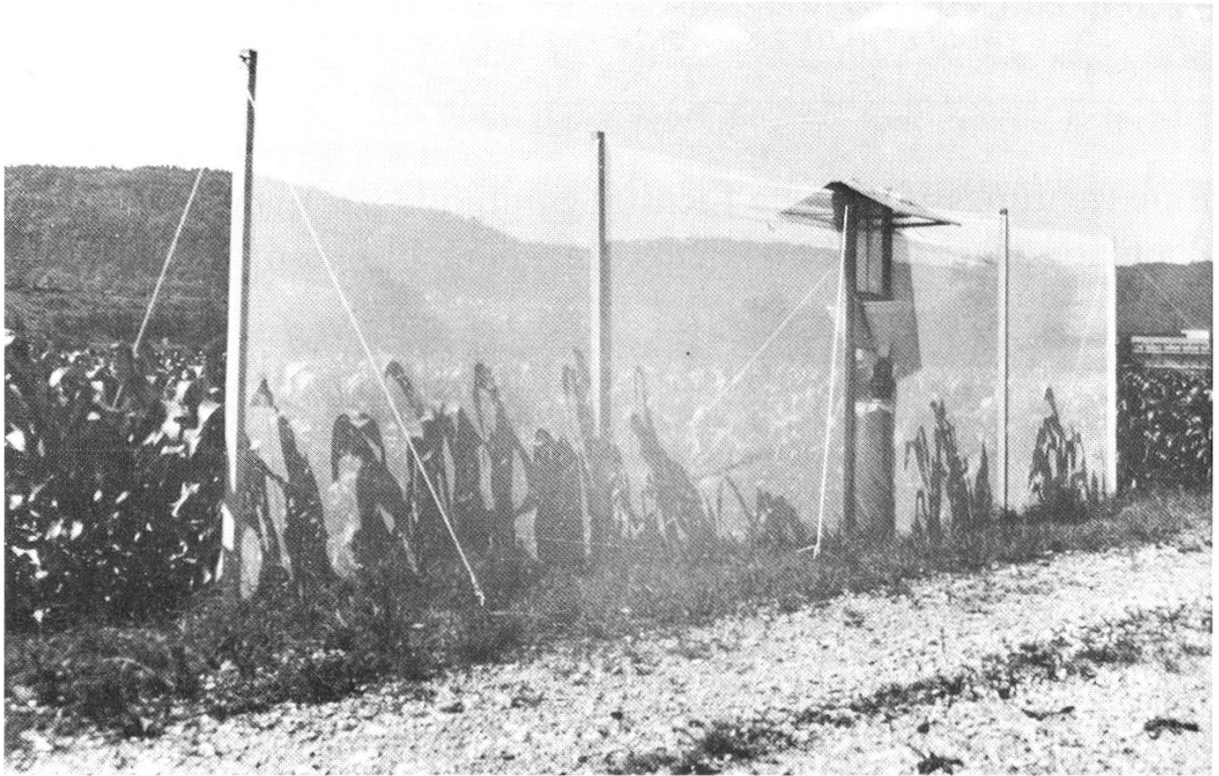
Abb. 1. Montierte Lichtfalle