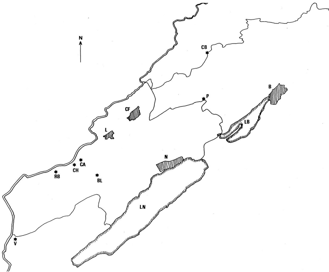
Fig. 1. Situation géographique des 7 tourbières visitées. V: mouille de la Vraconnaz, près du hameau de la Vraconnaz. BL: Bois-des-Lattes. RB: Rond-Buisson. CH: La Châtagne. CA: Le Cachot. P: Les Pontins. CB: La Chaux-des-Breuleux. Localités: N: Neuchâtel. CF: La Chaux-de-Fonds. L: Le Locle. B: Biemme. Lacs: LN: Lac de Neuchâtel. LB: Lac de Biemme. Double trait: frontière franco-suisse. Traits simples: frontières cantonales.

alpine, paléarctique, holarctique, subtropicale, cosmopolite) que lorsque nos ouvrages de référence sur ce point (SCHATZ, 1983; BALOGH & MAHUNKA, 1983) en font mention, témoignant d'une connaissance suffisante de la distribution du taxon concerné. Dans la majorité des cas cependant, nous considérons que l'état de la prospection ne permet pas une extrapolation du statut biogéographique général de l'espèce. Nos mentions se rapporteront par conséquent à des divisions d'ordre politique: