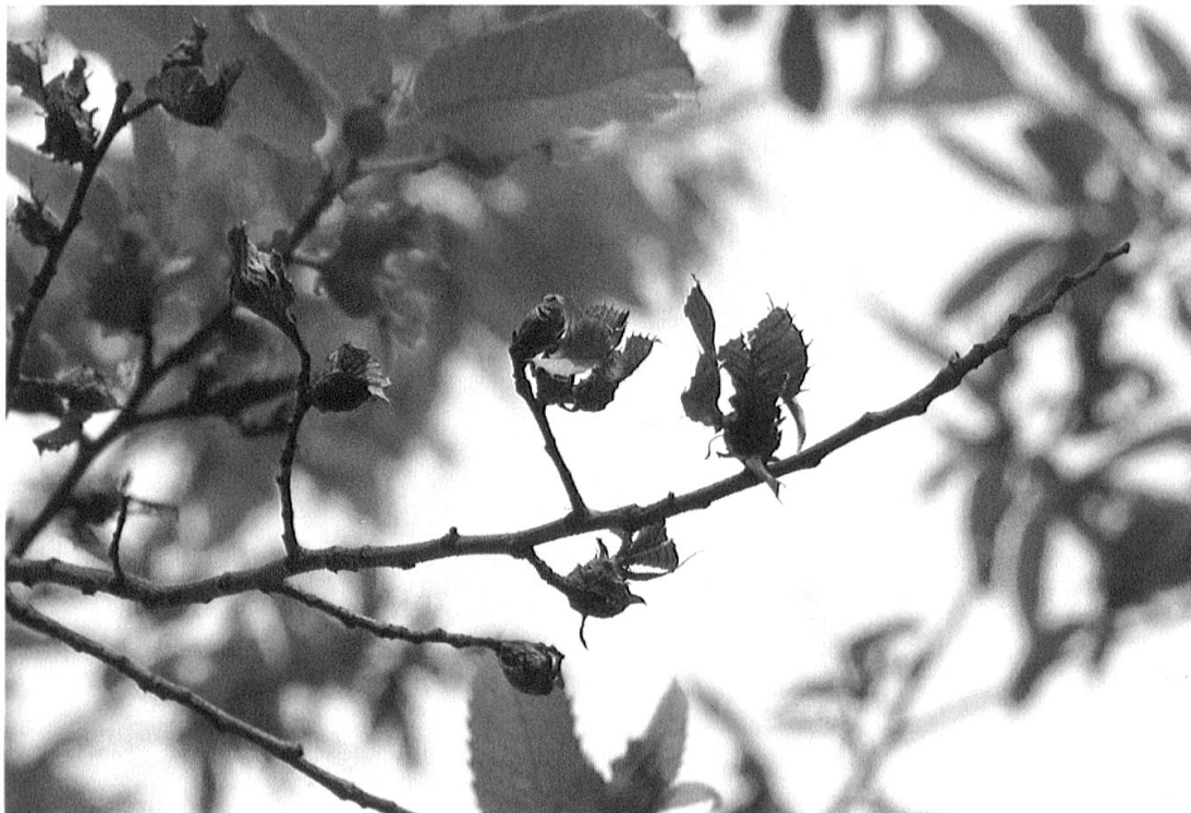
Abb. 5. Verlassene Gallen trocknen sehr rasch ein. Bei einem starken Befall kann auch der Kastanienzweig absterben.