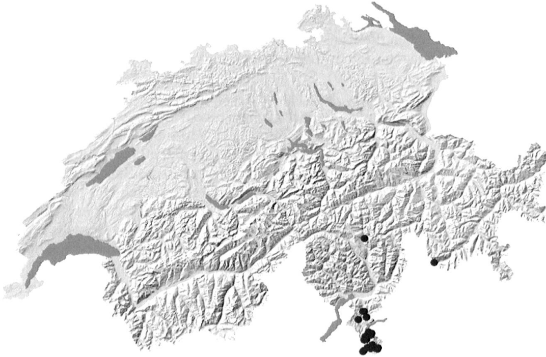
Abb. 6. Verbreitung der Edelkastaniengallwespe Dryocosmus kuriphilus in der Schweiz, Stand Herbst 2009. (Schwarze Punkte: Fundorte von Dryocosmus kuriphilus )

Torymus sinensis zwar nach wie vor vorhanden; die Befallsintensität an den japanischen Kastanien Castanea crenata sowie die gallwespenbedingten Ausfälle bei der Fruchtproduktion sind aber deutlich zurückgegangen. Weniger als 5 % der Triebe werden seither neu durch die Gallwespe befallen. Diese Freisetzung gilt als Paradebeispiel einer biologischen Bekämpfung mit einem eingeführten, natürlichen Feind.