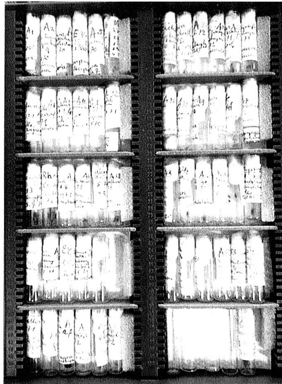
Abb. 3. In den Schachteln der Originalsammlung sind die Kleinzikaden in Glasröhrchen untergebracht.