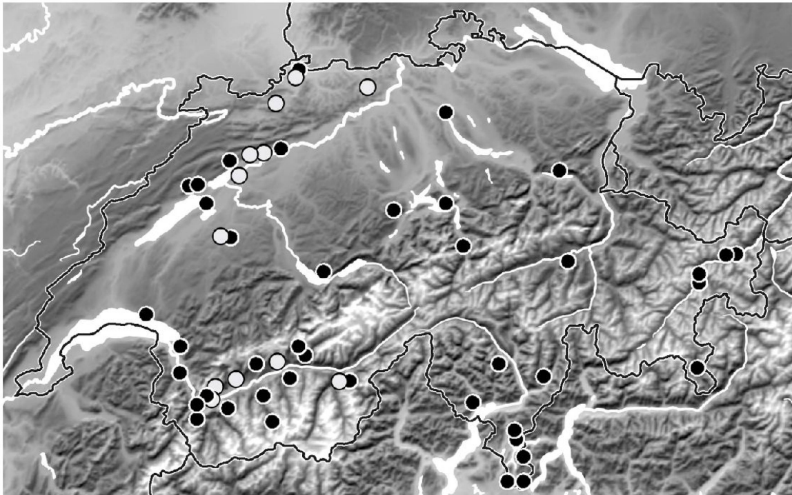
Abb. 9. Karte der Schweiz mit allen überprüften Funden von Cryptocephalus bameuli Duhaldeborde, 1999 (weisse Punkte) und C. flavipes Fabricius, 1781 (schwarze Punkte).

Matern, H.D. & Siede, D. 2001. Cryptocephalus bameuli Duhaldeborde 1999 – eine neue mitteleuropäische Blattkäferart auch im Rheinland. — Mitteilungen der Arbeitsgemeinschaft Rheinischer Koleopterologen (Bonn) 11: 29–32.