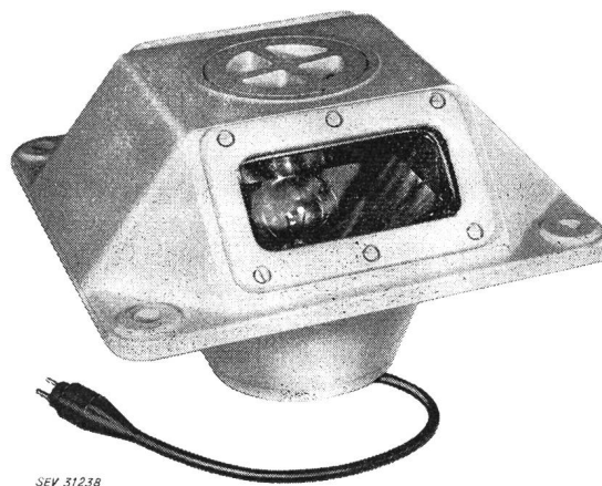
Fig. 1 Bodenfeuer

1. Bodenfeuer (Typ BOF 36) . Dieses Feuer schliesst plan mit der Erdoberfläche ab und stellt für das Flugzeug kein Hindernis beim Überrollen dar. Der Glaskörper ist als Linse ausgebildet, hat einen Lichtaustritt von 3...90^\circ über der Horizontalen. Der