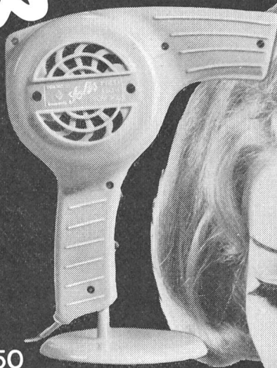
Nr. 54 Fr. 39.50