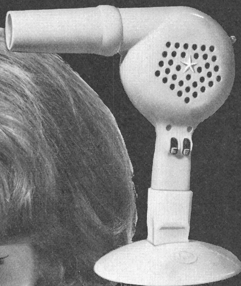
Nr. 105 Fr. 51.-

Für einen guten Haartrocknerverkauf brauchen Sie nur SOLIS!