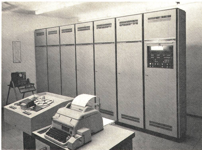
Fig. 4 Rechneraufstellung in den Gerloskraftwerken

wird, wurde auch ein Prozessrechner projektiert, der 1968 in Betrieb genommen werden konnte. Dieser Prozessrechner wurde auch darum notwendig, weil im Bereich des Gerloskraftwerkes von seiten der Verbundgesellschaft (Österreichische Elektrizitätswirtschafts-AG) ein 110/220-kV-Unterwerk errichtet wurde, das einerseits die erzeugte Energie aus der Gerlos-Gruppe übernimmt und andererseits die 220-kV-Einspeisung aus den Zemmkraftwerken dem österreichischen 220-kV-Netz zuführt. Das Unterwerk wird von der Schaltwarte im Gerloskraftwerk bedient.