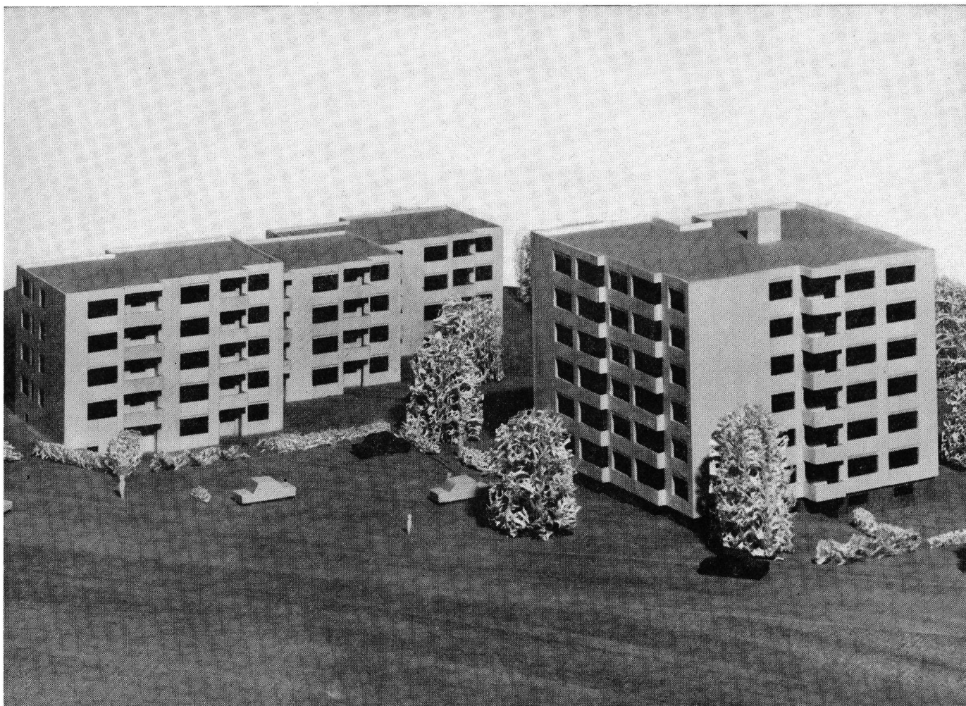
(Projektierung und Ausführung der Elektro-Heizanlage Star Unity AG, Fabrik elektrischer Apparate, Zürich, in Au/ZH)

Beheizen auch Sie Ihre Überbauungen vollelektrisch mit Star-Unity-Apparaten!