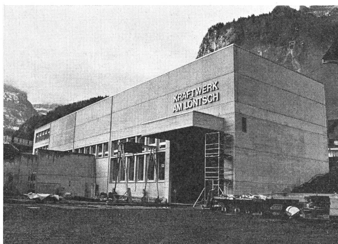
Umbau des Kraftwerkes Löntsch der NOK (Die Inbetriebnahme erfolgt am 15. Juni 1975)

20 % und gleichzeitig die Möglichkeit einer jährlichen prozentualen Anpassung der Tarife auf den Beginn eines Geschäftsjahres vorsieht. Auf dieser Grundlage sollte es möglich werden, über die Deckung der höheren Kosten infolge der Teuerung und der gestiegenen Zinsbelastung hinaus die Abschreibungen und Rückstellungen zu verstärken und eine stärkere Eigenfinanzierung für