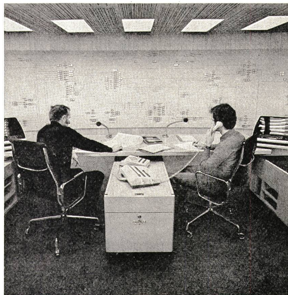
Blick in einen modernen Lastverteiler