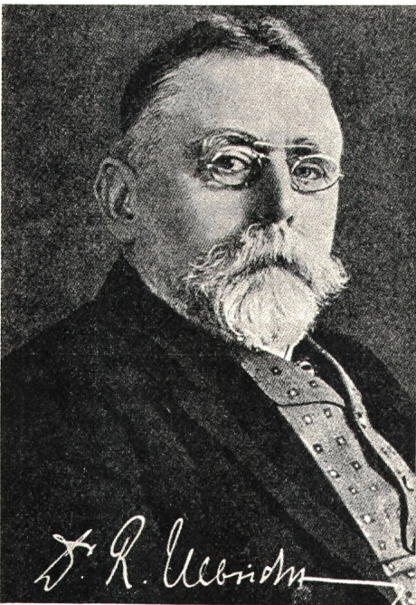
Sächsische Landesbibliothek Dresden

Richard Ulbricht, der Erfinder des Kugelphotometers, hat eine vielseitige Tätigkeit ausgeübt. Er war am 6. August 1849 als Sohn eines Münzengravers zur Welt gekommen; von seinem Vater dürfte er den Sinn für Genauigkeit geerbt haben.