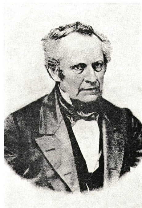
Deutsches Museum, München

1859 beobachtete er hinter der Anode einer Geissler-Röhre ein schwaches Leuchten. Er liess dann ein Loch in die Anode