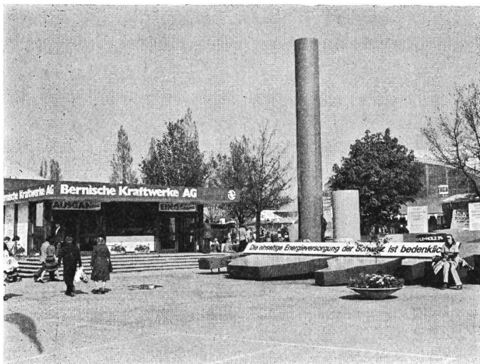
Ausstellungspavillon der BKW an der BEA

Der diesjährigen BEA war ein voller Publikumserfolg beschieden. Mehr als 345 000 Besucher besichtigten die Ausstellung, was einen neuen Besucherrekord bedeutete. Die BEA rangiert heute nach der Muba und dem Comptoir an dritter Stelle der Schweizerischen Ausstellungen. Der BKW-Pavillon hatte regen Besuch zu verzeichnen. Wir schätzen, dass zwischen 25 000 und 30 000 Besucher unsere Substitutionsausstellung gesehen haben.