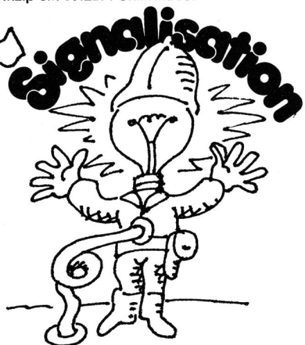
für die Strassen-Verkehrssignalan- lagen fabrizieren wir im Baukasten- prinzip WILBA-Signalkabel für Erdver- legung