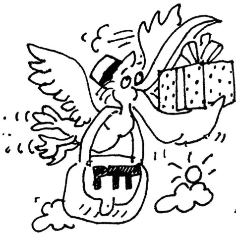
für das Postverteiler-Zentrum Däniken fabrizierten wir im Baukastenprinzip ein WILBA-Paketsortier-Steuerkabel