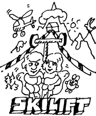
für einen bekannten Bündner Skilift- Betrieb fabrizierten wir im Baukasten- prinzip ein WILBA-Skiliftkabel