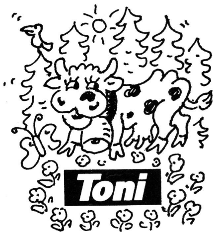
für die Toni-Molkerei in Zürich fabri- zierten wir im Baukastenprinzip diverse kombinierte WILBA-Speis- und Steuer- kabel