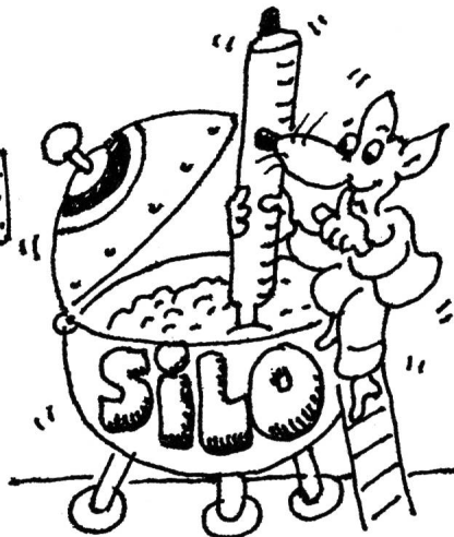
für viele Getreide-Silos in Europa fabrizieren wir im Baukastenprinzip WILBA-Temperaturmeldekabel