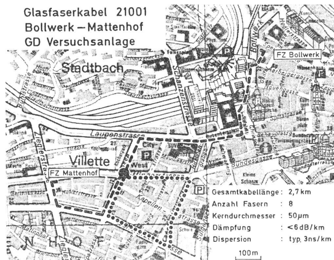
Fig. 1 Topologischer Plan der Anlage

Für den Feldversuch wird ein 8fasriges Glasfaserkabel mit zentralem Stahlzugseil verwendet. Als Schutz dient ein schwarzer Polyäthylenmantel. Da das Kabel auf ca. 70% der verlegten Länge in bestehenden Vollrohranlagen oder Betonkanälen verlegt ist, mussten Schutzmassnahmen getroffen werden, damit beim Einzug eines schweren Bleikabels das ca. 7 mm dünne optische Kabel nicht zerstört wird. Zu diesem Zweck wurde das Glasfaserkabel in ein Kunststoffrohr von ca. 28 mm