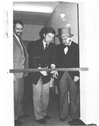
Eröffnungszereemonie mit einem Hauch von Vergangenheit

Im Wasserkraftwerk Mühleberg eröffneten die Bernischen Kraftwerke AG (BKW) am 22. Dezember 1981 ein Hausmuseum. Der Öffentlichkeit ist damit eine Sammlung von Dokumenten und technischen Objekten aus Vergangenheit und Gegenwart der Elektrizitätstechnik und der BKW zugänglich – dies zur Förderung des allgemeinen Verständnisses für die Bedeutung der Elektrizität im privaten und gesellschaftlichen Leben der heutigen Zeit. Durch das Aufzeigen von Entwicklungslinien aus der Vergangenheit in die