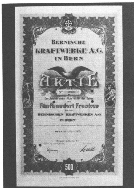
Eine der ersten BKW-Aktien