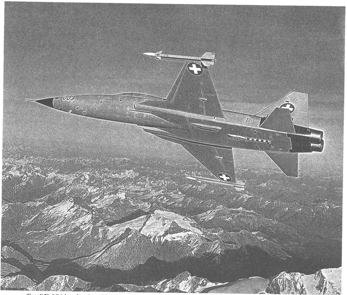
Tiger F-5E, 2 Triebwerke mit total 4550 kg Schub. Spannweite 8 m. Länge 14 m. Leergewicht 4300 kg, max. Abfluggewicht 10 800 kg, Geschwindigkeit 1700 km/Std.