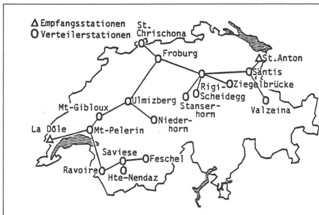
Fig. 1 Heutiges PTT-Richtstrahl-Zubringernetz (GAZ) (Stand November 1982)