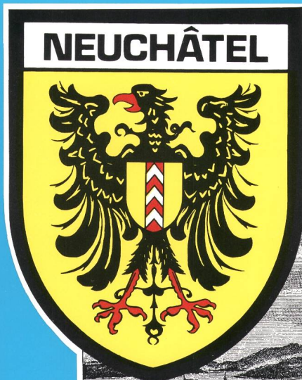
La ville de Neuchâtel, vers 1780

des Verbandes Schweizerischer Elektrizitätswerke de l'Union des Centrales Suisses d'Electricité