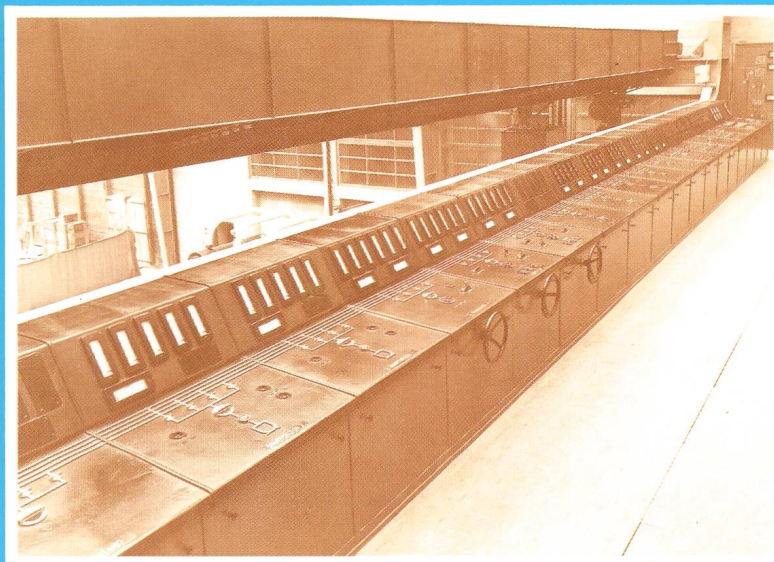
Fernheizkraftwerk der ETH altes (links) und neues (rechts) Kommandopult in der Schaltwarte

des Verbandes Schweizerischer Elektrizitätswerke de l'Union des Centrales Suisses d'Electricité