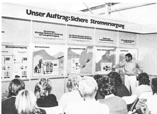
Sarganser Schulklasse während einer Führung im NOK-Stand Classe d'école de Sargans pendant une visite guidée du stand NOK

Erstmals wurden die Schulen ausserhalb der normalen Öffnungszeiten eingeladen. Viele Lehrer profitierten von diesem Angebot und liessen sich mit ihren Schülern die Grundzüge der Stromproduktion, Stromübertragung und Stromverteilung erklären. Die vielen Fragen, die von den jungen Sarganserländern gestellt wurden, zeigen deutlich, wie wichtig und sinnvoll eine Information von Werksseite her ist. Der grosse Erfolg in Mels ermutigte die NOK, auch an den Ausstellungen in Schaffhausen und Winterthur die Schulen gezielt und zu Spezialöffnungszeiten einzuladen. Auch hier nutzten viele Lehrer die Gelegenheit und besuchten mit ihren Schülern die NOK-Ausstellung «Energie mit Zukunft».