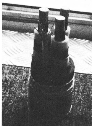
Fig. 1 Modell des verwendeten Seekabels

Als Besonderheit wurde ein Polymerkabel mit einem Schichtenmantel aus Aluminium über dem äusseren Halbleiter gewählt. In das Energiekabel ist zudem ein Steuerkabel mit einem Schichtenmantel eingesetzt für die Übertragung von Signalen und Steuerbefehlen (Fig. 1). Der Schichtenmantel wurde für dieses Seekabel ge-