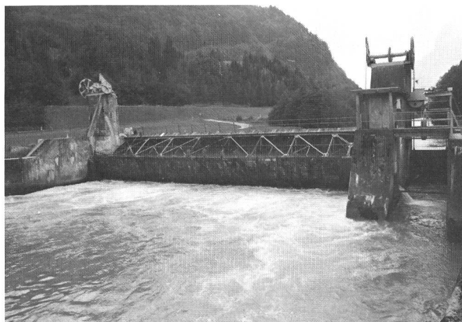
Fig. 1 Stauwehr vor dem Umbau mit den Wasserverlusten