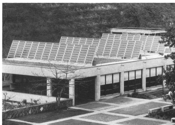
Fig. 2 Die Solarzellen-Anlage TISO-15 an der HTL Lugano, mit 15 kW Leistung die derzeit grösste in der Schweiz, ist ebenfalls NEFF-gefördert

besitzer - wie bei INFOSOLAR, den NEFF-unterstützten Beratungsstellen für erneuerbare Energien in Brugg, Bellinzona und Colombier.