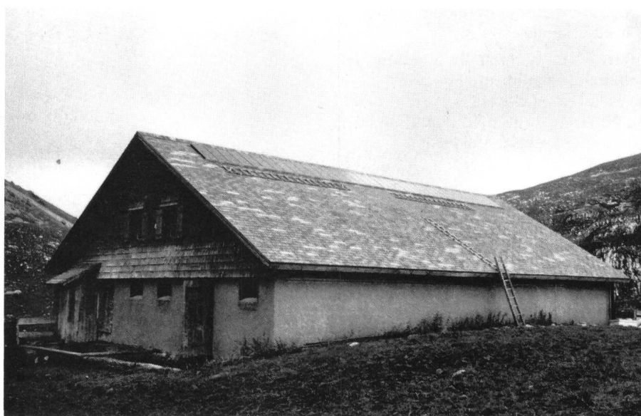
Fig. 1 Alphütte Chlus mit 1,2-kW-Solaranlage

Für die Elektrifizierung der Alphütte Chlus bei Sörenberg waren die Bedingungen äusserst schlecht. Der Karrweg von der Alp Schlund zur Alphütte Chlus lässt sich nicht mit gewöhnlichen Autos befahren. Aus topographischen und aus Naturschutzgründen war die Erstellung einer Freileitung nicht möglich. Die CKW und die Elektrowatt Ingenieurunternehmung haben daher eine andere Lösung erarbeitet und einen neuen Schritt gewagt, nämlich mittels photovoltaischer Zellen die Sonne als Energiequelle zu benutzen. Seitens des Heimatschutzes wurde eine möglichst unauffällige Integration der Solarzellen im bestehenden Dach der Alphütte gefordert. Mit dem Einsatz von farblich angepassten und reflexionsarmen Solarzellen konnte dieser Wunsch erfüllt werden (Fig. 1).