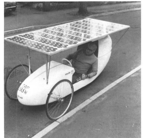
Fig. 3 Dasselbe Solarmobil in einer Variante ohne Zusatzantrieb