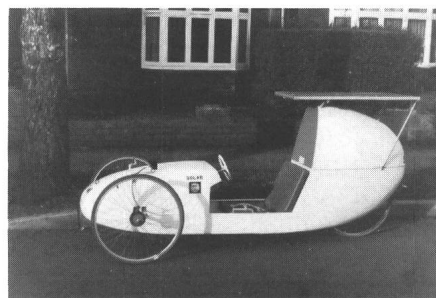
Fig. 2 Englisch Solarmobil mit zusätzlichem Pedalantrieb

In einigen Wochen zählen diese Fahrzeuge schon zur ersten Genera-