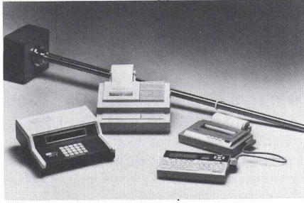
Einige Komponenten des Füllstand-Mess- und -Steuersystems für Flüssigkeiten (Hectronic)

men, mit denen die Daten und Protokolle direkt auch weiter übertragen und verteilt werden können. Daneben werden im Kundenauftrag Printplatten bestückt.