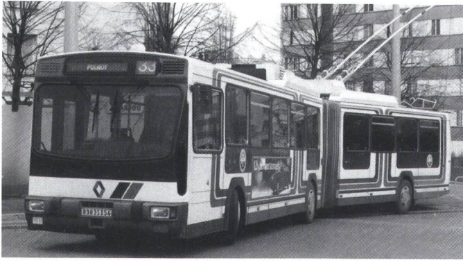
Fig. 4 Trolleybus bi-mode PER 180 H en service à Nancy

si ce n'est des remaniements de lignes en liaison avec l'établissement de tramways ou de métros (p. ex. à Grenoble).