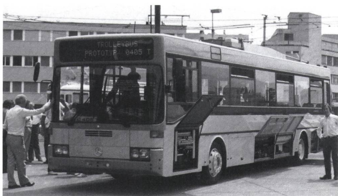
Fig. 2 Trolleybus Mercedes/AEG O 405 T

Près de 400 véhicules desservent les réseaux de Grenoble, Limoges, Lyon, Marseille, Nancy et St-Etienne. Le parc de véhicules, renouvelé ces dix dernières années, est particulièrement homogène, puisqu'il se compose presque exclusivement de deux types: l'un à deux essieux, avec un groupe d'autonomie diesel, et l'autre articulé, qui n'existe qu'en version bi-mode, voir la figure 4. Nancy possède un réseau très récent de 3 lignes totalisant 30 km, établi entre 1982 et 1984 et desservi au moyen de 48 véhicules articulés PER 180H. Une quatrième ligne doit être réalisée incessamment. Dans les autres villes, il n'est pas prévu d'extensions,