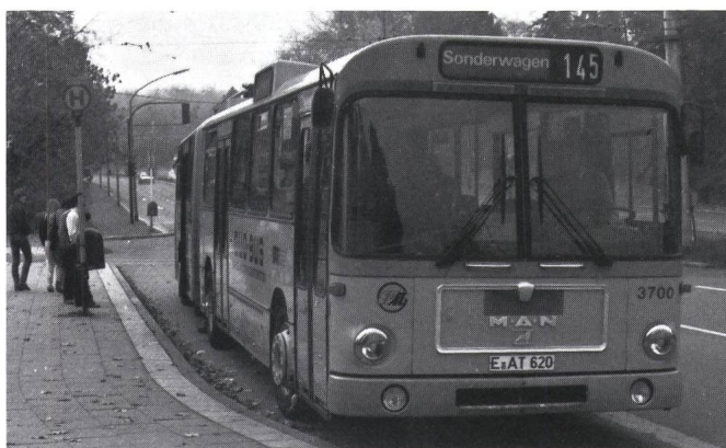
Fig. 3 Trolleybus bi-mode MAN/Siemens sur le tronçon d'essais à Essen

Solingen possède un vaste réseau de 4 longues lignes au profil accidenté, exploité au moyen de 20 trolleybus articulés à deux essieux moteurs et environ 55 trolleybus à une caisse et trois essieux, qu'il est prévu de remplacer par des véhicules de même configuration, mais de conception récente.