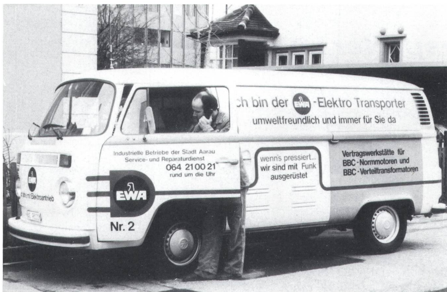
Fig. 2 Ein Elektrotransporter im täglichen Einsatz als Servicefahrzeug bei den Industriellen Betrieben der Stadt Aarau