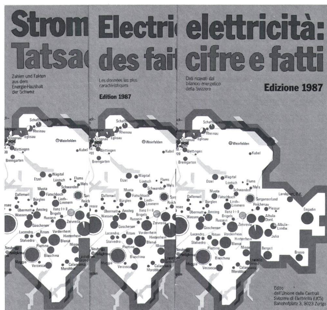
Stromtatsachen: Wissenswertes in drei Sprachen.

Daneben werden Zahlen und Fakten aus dem Energiehaushalt der Schweiz, visualisiert durch zahlreiche übersichtliche Tabellen und Illustrationen, präsentiert. Aktuelle Themen wie «Fernwärme aus Kraftwerken» oder «Schweizerischer Stromtausch mit dem Ausland im Winterhalbjahr» werden knapp, aber anschaulich behandelt. Dieses vom VSE herausgegebene, hilfreiche Informationsmittel kann bei den Elektrizitätswerken bezogen werden. Es