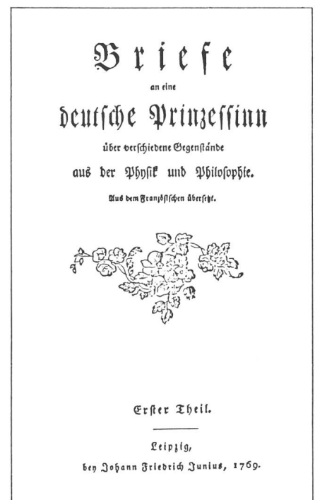
Figur 2 Leonhard Eulers «Briefe an eine deutsche Prinzessin», 1769

L. Euler war nicht nur Mathematiker, er beschäftigte sich vielmehr auch intensiv mit Physik [10]. Sein Hauptwerk über die Naturphilosophie trägt allerdings einen ungewöhnlichen Titel: «Briefe an eine deutsche Prinzessin über verschiedene Gegenstände aus der Physik und Philosophie» (Fig. 2). Friedericke Charlotte , Tochter des Markgrafen Friedrich von Brandenburg-Schwedt, wurde seit ihrem fünfzehnten Lebensjahr, 1759, von Euler unterrichtet. Die Briefe entstanden zwischen 1760 und 1762 und handeln