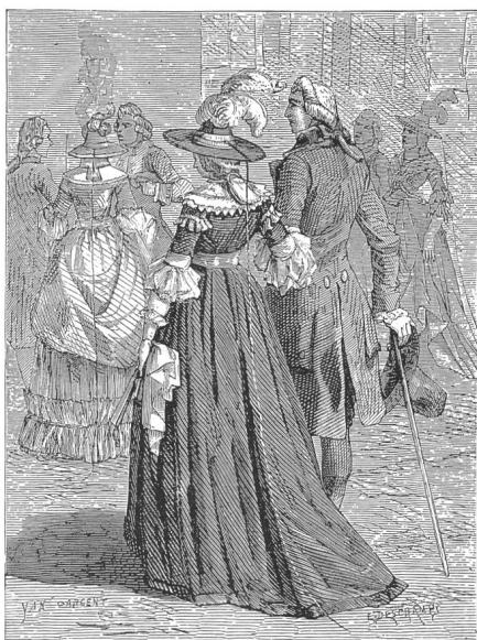
Figur 5 Damenhut mit Blitzableiter, Paris, 1778

In den Augen der Öffentlichkeit war die Elektrizität im 18. Jahrhundert zwar eine interessante, aber praktisch unnütze Erscheinung. Das einzige für die Praxis anwendbare Resultat der Elektroforschung war der Blitzableiter, dessen Anwendung sich seit den siebziger Jahren langsam verbreitete [18]. Die Popularität des Blitzableiters war bald so gross, dass dieser Ende der siebziger Jahre sogar zum Bestandteil der Frauenmode wurde: Die Hüte der