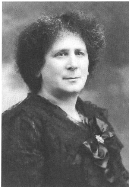
Figur 8 Hertha Ayrton (1854–1923)

Seit dem Tod von Hertha Ayrton , 1923, hat sich kaum eine Frau mehr erfolgreich mit der elektrischen Materie