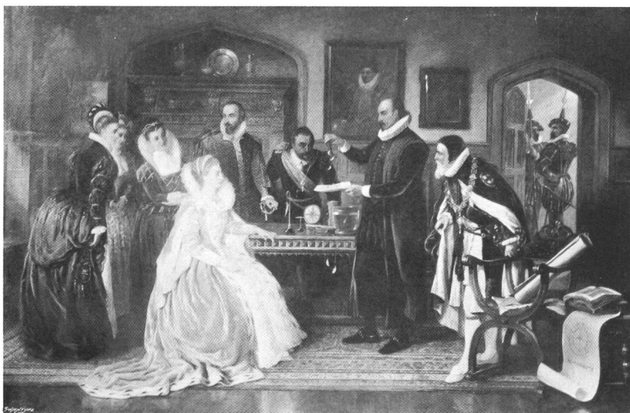
Figur 1 W. Gilbert führte um 1600 Königin Elisabeth I. elektrische Experimente vor