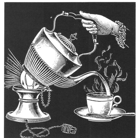
Figur 6 Elektrische Teekanne, 1893

Durch die Elektrizität sind viele neue Frauenberufe entstanden. In den Telefonzentralen, die seit Ende der