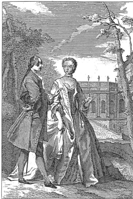
Figur 4 Algarottis «Il Newtonianismo per le dame», 1737, wurde unter dem Titel «Newton Welt-Wissenschaft für das Frauenzimmer» in deutsch veröffentlicht. Algarotti, ein Freund Friedrichs des Grossen, starb 1764