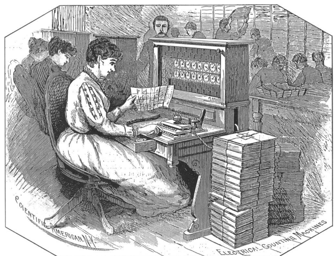
Figur 7 Elektrische Rechenmaschinen in den USA, 1890

Die bekannteste Frauenfigur in der ganzen Geschichte der Naturwissenschaft ist zweifellos Marie Curie [19]. Marie Sklodowska wurde 1867 in