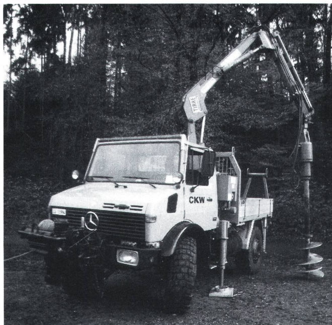
Figur 3 Unimog mit Kran und Erdbohrer

Für den Unterhalt öffentlicher Beleuchtungen (heute ca. 25 000 Lampenstellen, bei steter Zunahme) sind bei den CKW zwei Mercedeslastwagen mit Arbeitshebebühne im Einsatz (Fig. 4). Für die Auswechslung defekter bzw. alter Lampen muss die Arbeitsbühne in allen drei Dimensionen eine möglichst grosse Bewegungsfreiheit haben. Das hier beschriebene Fahrzeug erfüllt die gestellten Anforderungen bestens. Dank den hydraulischen Abstützungen, welche einzeln ausgefahren werden können, und des