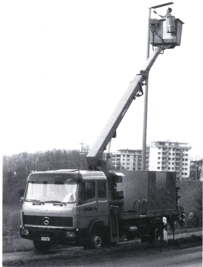
Figur 5 Mercedes-Lastwagen mit Arbeitsbühne

grossen Bewegungsbereiches der Arbeitsbühne können auch schwer zugängliche Lampenstellen erreicht werden. Der Einsatz muss sich nicht nur auf die öffentliche Beleuchtung beschränken. Auch wo in gewisser Höhe Arbeiten auszuführen sind (z.B. zum Ausholzen von Leitungszügen usw.), eignet sich dieses Arbeitsmittel bestens.