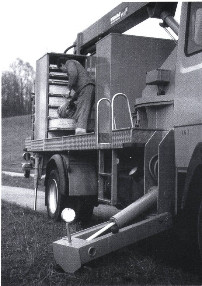
Figur 4 Mercedes-Lastwagen mit hydraulischen Stützen und Werkzeugkästen