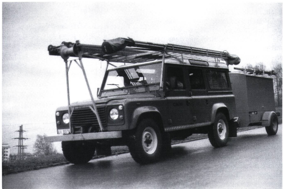
Figur 1 Land-Rover 110 mit Anhänger