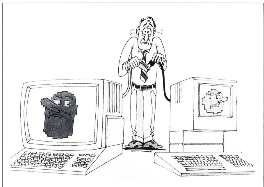
Figur 1 Schnittstellenprobleme

Dies hat bereits zu ersten Normen und Standards geführt. Elemente wie SDLC oder HDLC, Ethernet oder SCSI, aber auch die Sprachen Fortran oder C sind heute nicht mehr wegzudenken.