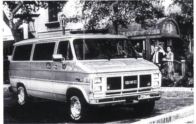
Figur 5 Der Elektrotransporter «G-van» von General Motors (USA)

Firma Eagle Picher ausgewählt, obwohl dieses Programm noch nicht das Prototypen-Stadium erreicht hat. Zu den weiteren amerikanischen Nutzfahrzeug-Projekten, die vom amerikanischen Departement of Energy finanziert werden, gehört der Ford «ETX-II Aerostar van», der als Basis-Testfahrzeug für den heute verfügbaren Wechselstromantrieb dienen wird sowie für Natrium-Schwefel-Batterien, die von Chloride Silent Power Ltd. geliefert werden. ETX bedeutet electric transaxle. Ein weiteres Projekt, das von der Eaton Corporation in den USA entwickelt wird, beinhaltet ein elektrisches Antriebssystem mit Doppelwelle (dual-shaft electric propulsion, DSEP).