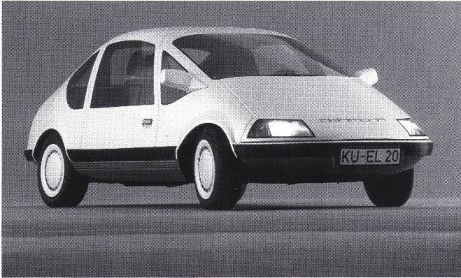
Figur 1 Der Pöhlmann EL (BRD)