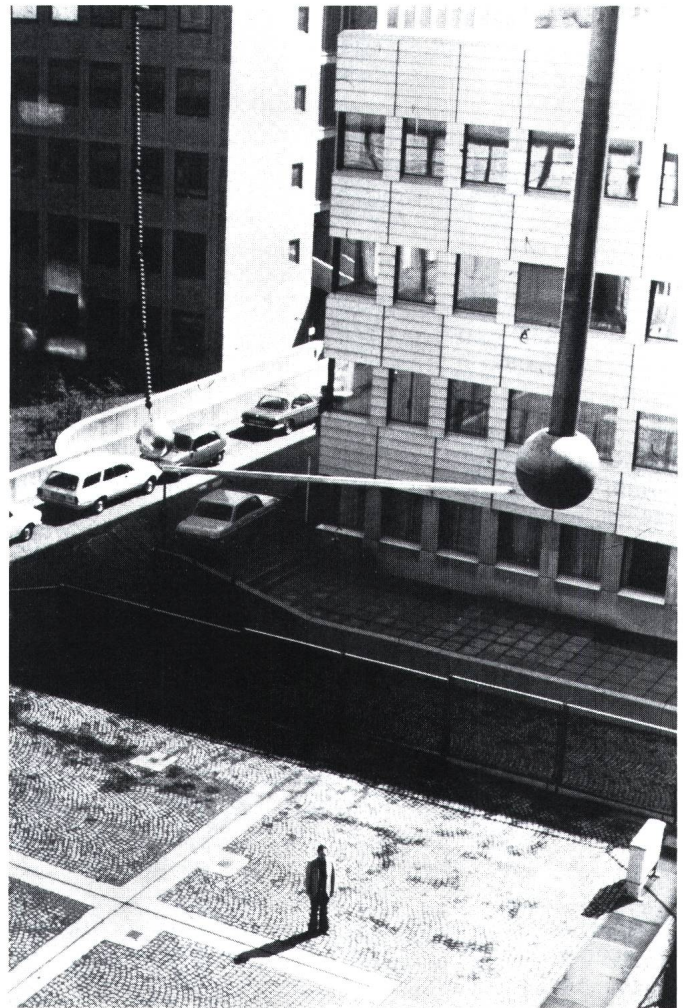
Figur 4 Versuchsanordnung im Freigelände der TU München mit einer stehenden Person im Feldraum

Lärmwirkungen treten sicher messbar ab einem Lärmpegel von 75 dB(A) auf. Für überwiegend geistige Tätigkeit gilt ein Richtpegel von 50 dB(A). Normalerweise hält sich der Lärm von unseren Hochspannungsleitungen in zumutbaren Grenzen.