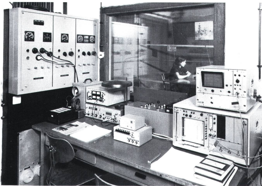
Figur 3 Mess- und Steuereinrichtung

ke von 20 kV/m erweitert. Die Versuchsgruppen wurden bei einer Expositionszeit von fünf Stunden vergrößert und das Untersuchungsprogramm ausgedehnt auf das Verhalten der Elektrolyte des intermediären Stoffwechsels und der wichtigsten Hormone zur Beurteilung von Stressreaktionen. Auch hier zeigten sich keine signifikanten Unterschiede zwischen den Exponierten und den Vergleichsgruppen, insbesondere ergab sich kein Anhalt für Stressreaktionen.