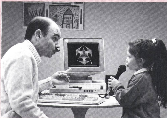
Speechviewer – ein Hilfsmittel für die Sprachschulung

licht dem Sprachbehinderten, Laute auf dem Bildschirm zu sehen. Speechviewer wurde in über zehnjähriger Forschungsarbeit entwickelt und berücksichtigt Erfahrungsberichte von Fachleuten, die mehrere hundert Prototypen in der Praxis einsetzen konnten.