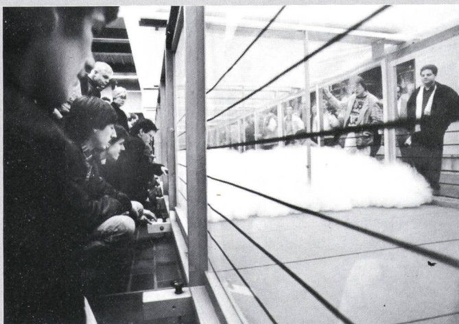
Versuchskanal zur Erforschung der Ausbreitung von Schwergaswolken

um darin das Verhalten von Schwergaswolken unter wiederholbaren Versuchsbedingungen studieren zu können. Dieses Forschungsinstrument ist 22 m lang, 2 m breit, 1,5 m hoch und mit elektronischen Fühlern und Thermometern gespickt. Zur Simulation der Havarie eines Flüssiggastankers wird verflüssigter Stickstoff auf die Oberfläche eines Wasserbeckens geschüttet. Es bildet sich eine dichte, kalte Gaswolke, die sich im Fussgänger-tempo über den Behälterboden wälzt. Ihre Bewegung und Verformung wird gefilmt, während gleichzeitig die zahlreichen Feuchtigkeits- und Temperaturfühler registrieren, wie die «Wolke» sich allmählich erwärmt, verwirbelt und sich mit der Umgebung vermischt.