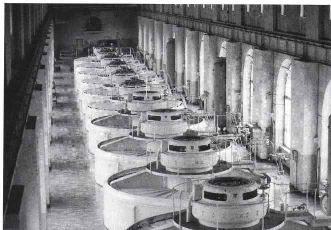
Blick in den Maschinensaal

Nur mit Sparen allein lasse sich aber die Wende nicht herbeiführen, die Versorgungsaufgabe der NOK lasse sich nur mit Stromimporten aus Frankreich erfüllen. Aus diesem Grunde wurden zusammen mit den Partnern BKW und EOS die sogenannten Cattenom-Verträge ausgehandelt. Diese sichern den NOK ab 1989 Be-